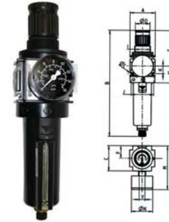
Misure in mm